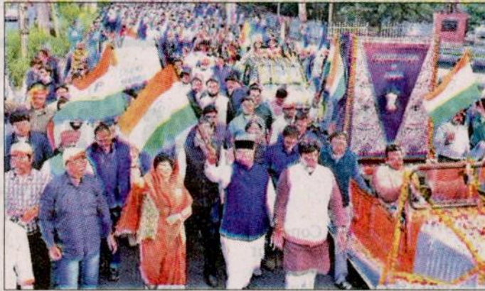
People in large numbers taking part in the Padyatra to pay respects to the replica of the Indian Constitution on Constitution Day.