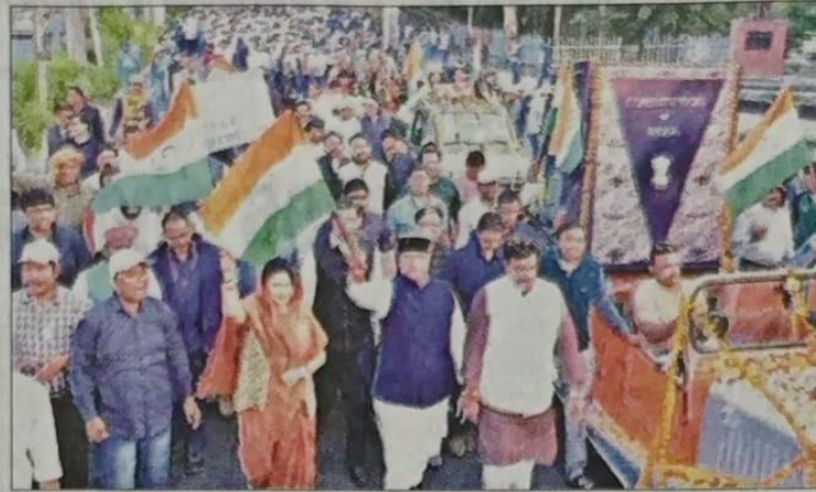
People in large numbers taking part in the Padyatra to pay respects to the replica of the Indian Constitution on Constitution Day.