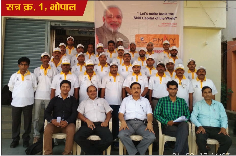
सत्र क्र. 1, भोपाल