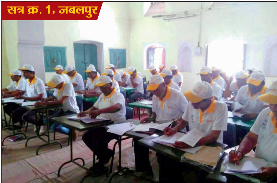
सत्र क्र. 1, जबलपुर