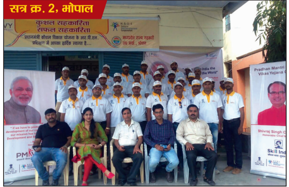
सत्र क्र. 2, भोपाल