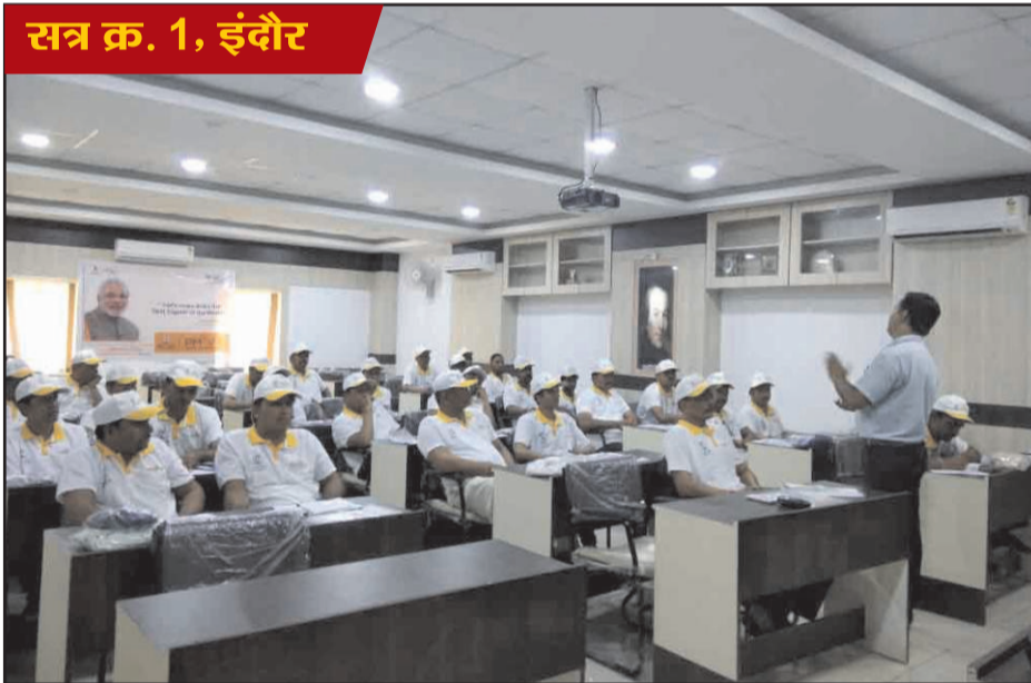
सत्र क्र. 1, इंदौर