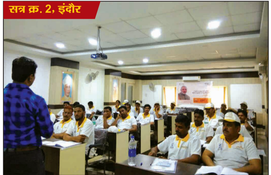
सत्र क्र. 2, इंदौर