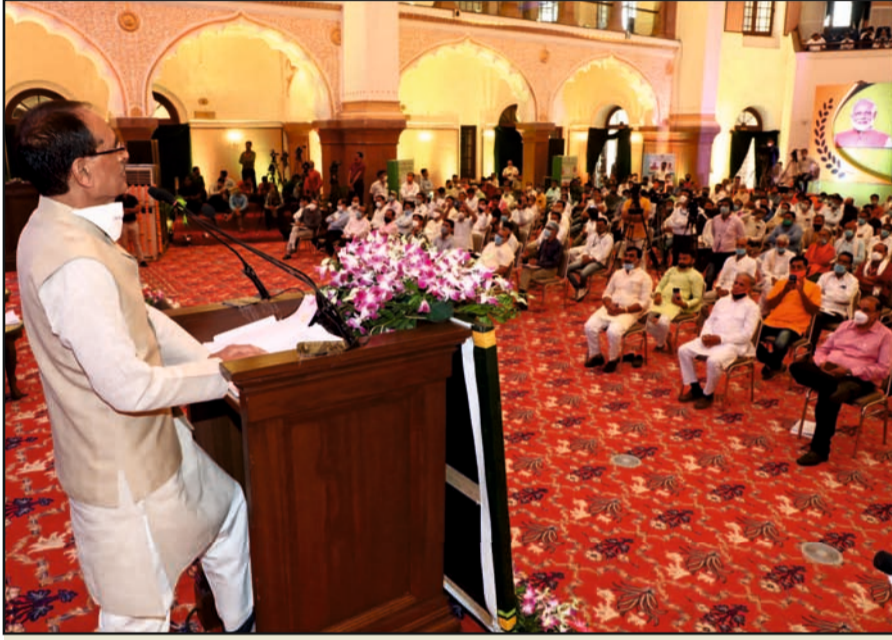
मुख्यमंत्री श्री शिवराज सिंह चौहान ने 'सबको साख-सबका विकास' कार्यक्रम को संबोधित किया।

पेक्स स्तर तक सहकारी संस्थाओं का कम्प्यूटराइजेशन होगा