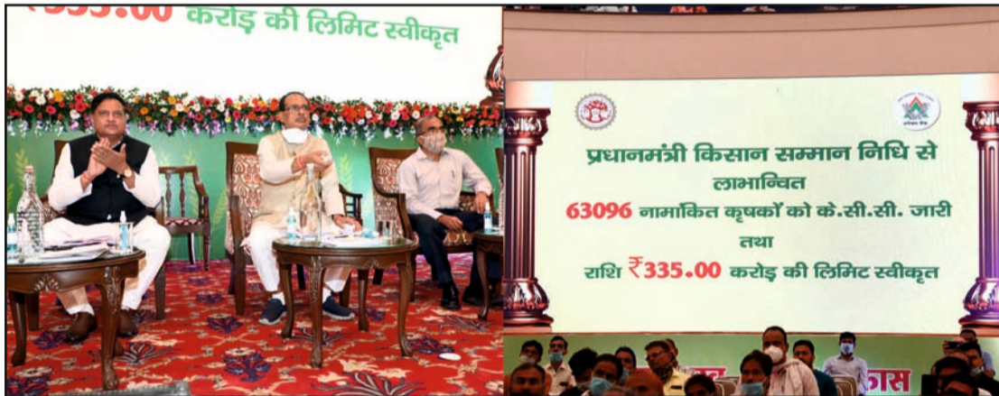
मुख्यमंत्री श्री शिवराज सिंह चौहान ने नये किसान हितग्राहियों को किसान क्रेडिट कार्ड, सहकारी बैंकों/समितियों को शासकीय सहायता किसानों को जीरो प्रतिशत ब्याज पर ऋण उपलब्ध कराने के लिये डिजिटली अंतरित की।

भोपाल। मुख्यमंत्री श्री शिवराज सिंह चौहान ने कहा है कि मध्यप्रदेश सरकार प्रधानमंत्री श्री मोदी के किसानों की आय वर्ष 2022 तक दोगुनी करने के संकल्प को पूरा करने में कोई कसर नहीं छोड़ेगी। प्रदेश में मुख्यमंत्री किसान कल्याण योजना प्रारंभ होगी। इस योजना का उद्देश्य प्रधानमंत्री किसान सम्मान निधि के पात्र हितग्राहियों को चार हजार रुपये की अतिरिक्त आर्थिक सहायता दिलवाना है। करीब 80 लाख किसान इससे लाभान्वित होंगे। वर्तमान में योजना के अंतर्गत ऐसे छोटे-छोटे किसानों को जो अन्य योजनाओं के लाभ नहीं ले पाते हैं, उन्हें वार्षिक छह हजार रुपये की सहायता प्रदान की जाती है। अब हितग्राही किसान को 10 हजार रुपये की वार्षिक सहायता मिल सकेगी। किसानों के समग्र विकास की दृष्टि से किसान हितैषी योजनाओं को एक पैकेज के रूप में समाहित कर लागू किया जाएगा। सहकारिता विभाग में कम्प्यूटराइजेशन का कार्य व्यापक स्तर पर होगा। साढ़े चार हजार प्राथमिक सहकारी समितियों में इस व्यवस्था के लिए राज्य शासन धनराशि उपलब्ध करवाएगा। मुख्यमंत्री श्री चौहान प्रधानमंत्री श्री नरेन्द्र मोदी के जन्म दिवस से आरंभ गरीब कल्याण सप्ताह के अंतर्गत 22 सितंबर, 2020 को मिनटो हाल भोपाल में