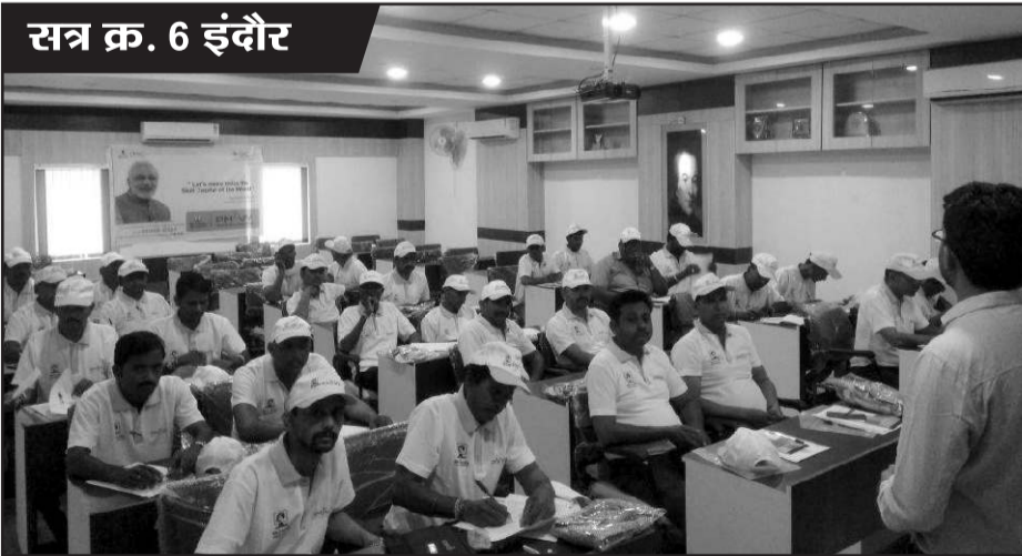
सत्र क्र. 6 इंदौर