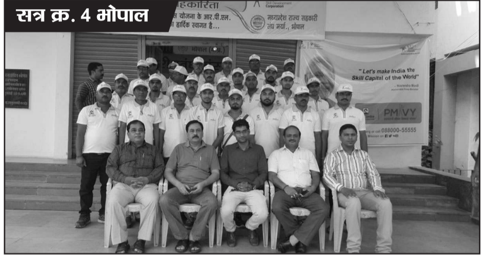
सत्र क्र. 4 भोपाल