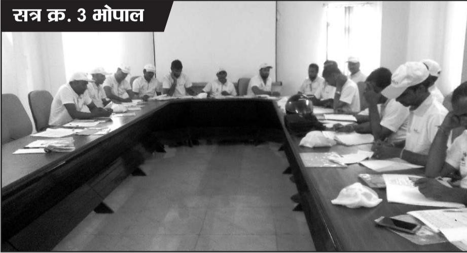
सत्र क्र. 3 भोपाल