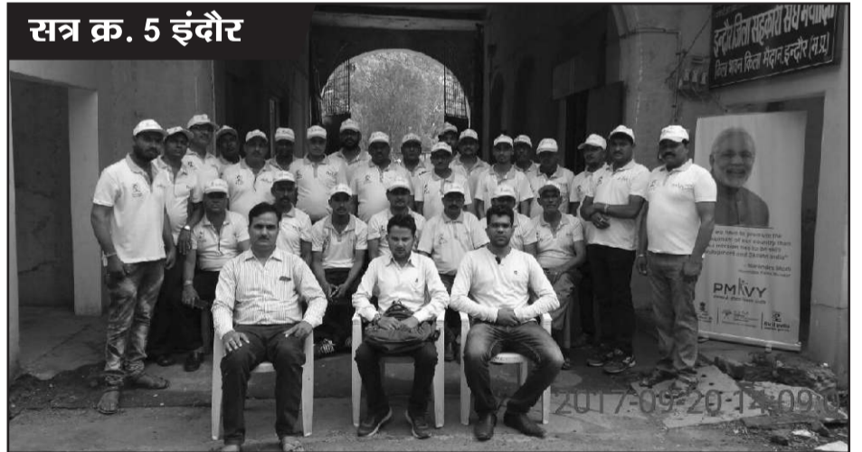
सत्र क्र. 5 इंदौर