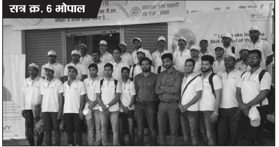
सत्र क्र. 6 भोपाल