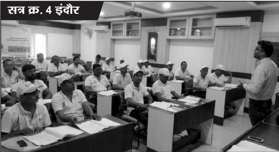
सत्र क्र. 4 इंदौर