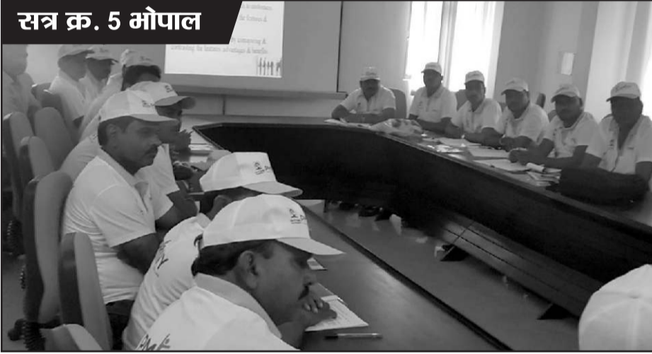
सत्र क्र. 5 भोपाल