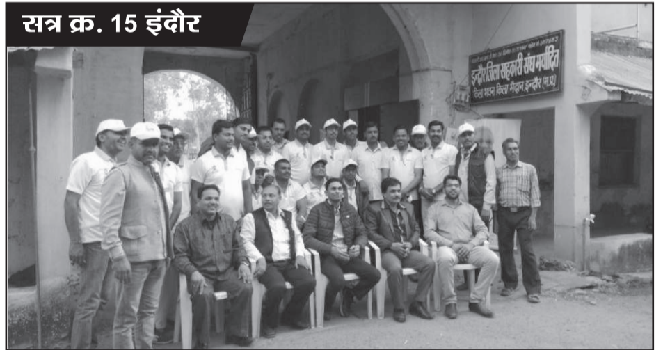
सत्र क्र. 15 इंदौर