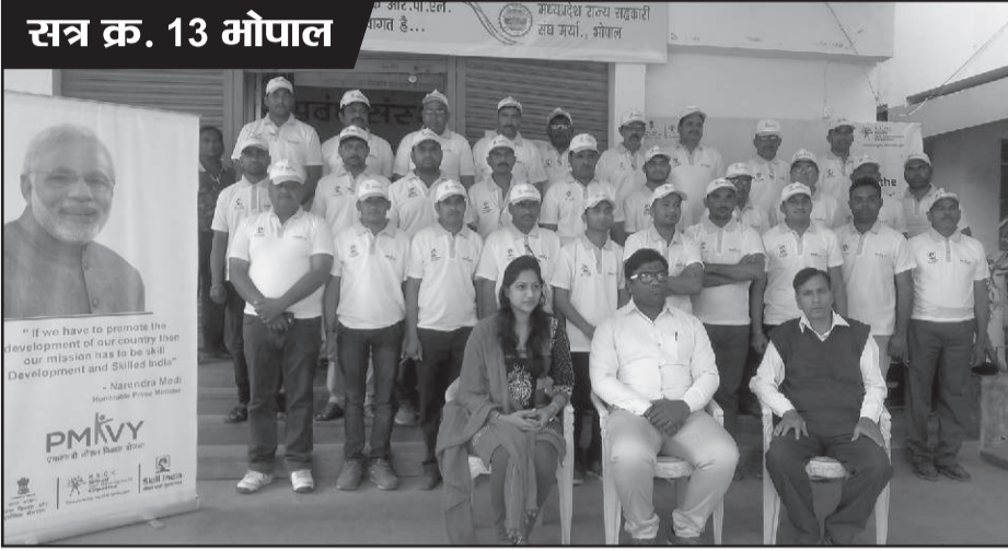
सत्र क्र. 13 भोपाल