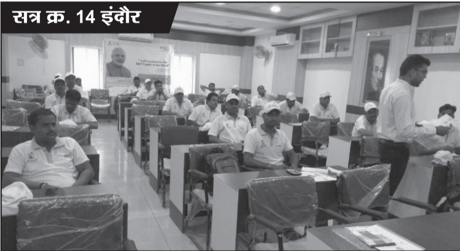
सत्र क्र. 14 इंदौर