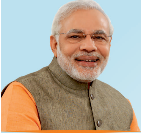
श्री नरेन्द्र मोदी, प्रधानमंत्री