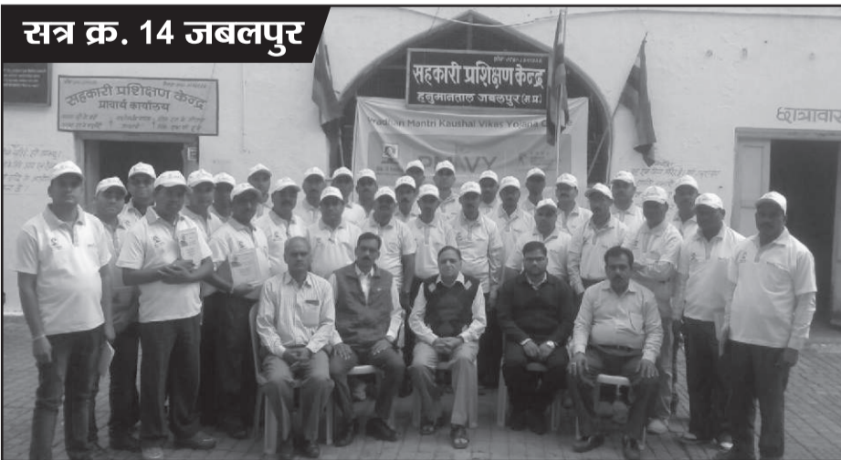
सत्र क्र. 14 जबलपुर