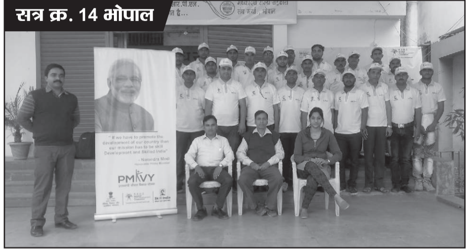
सत्र क्र. 14 भोपाल