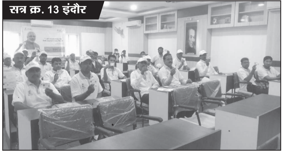
सत्र क्र. 13 इंदौर