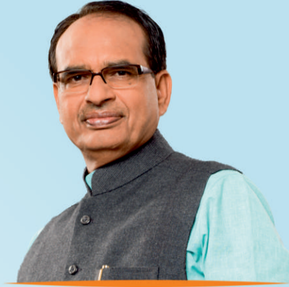
श्री शिवराज सिंह चौहान, मुख्यमंत्री