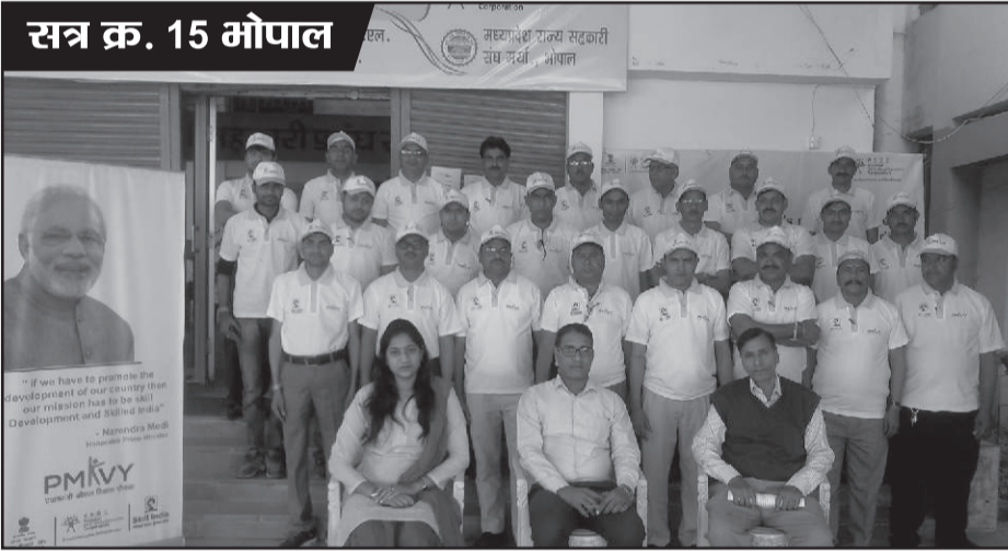
सत्र क्र. 15 भोपाल