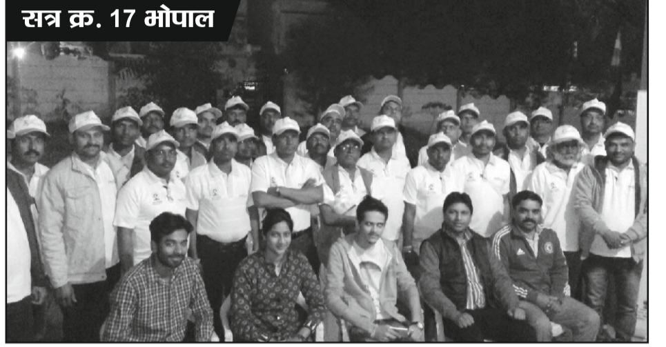
सत्र क्र. 17 भोपाल