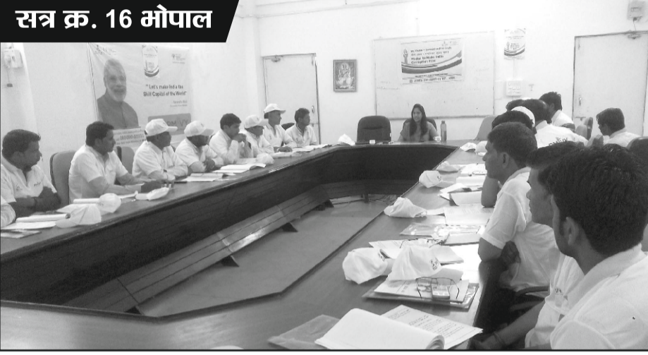
सत्र क्र. 16 भोपाल