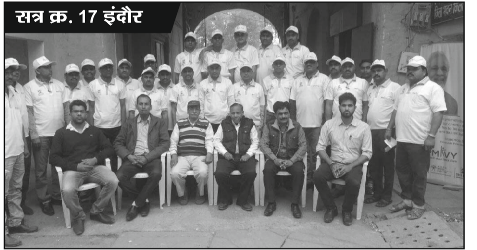
सत्र क्र. 17 इंदौर