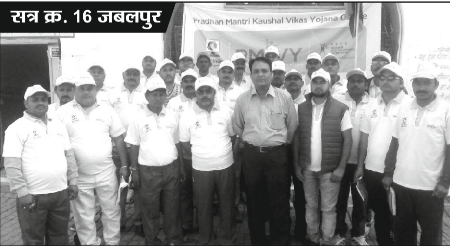
सत्र क्र. 16 जबलपुर