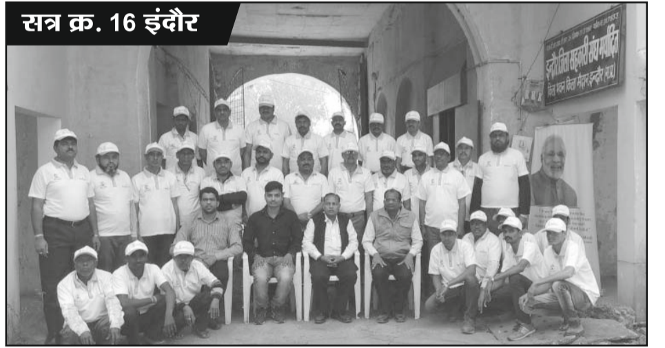
सत्र क्र. 16 इंदौर